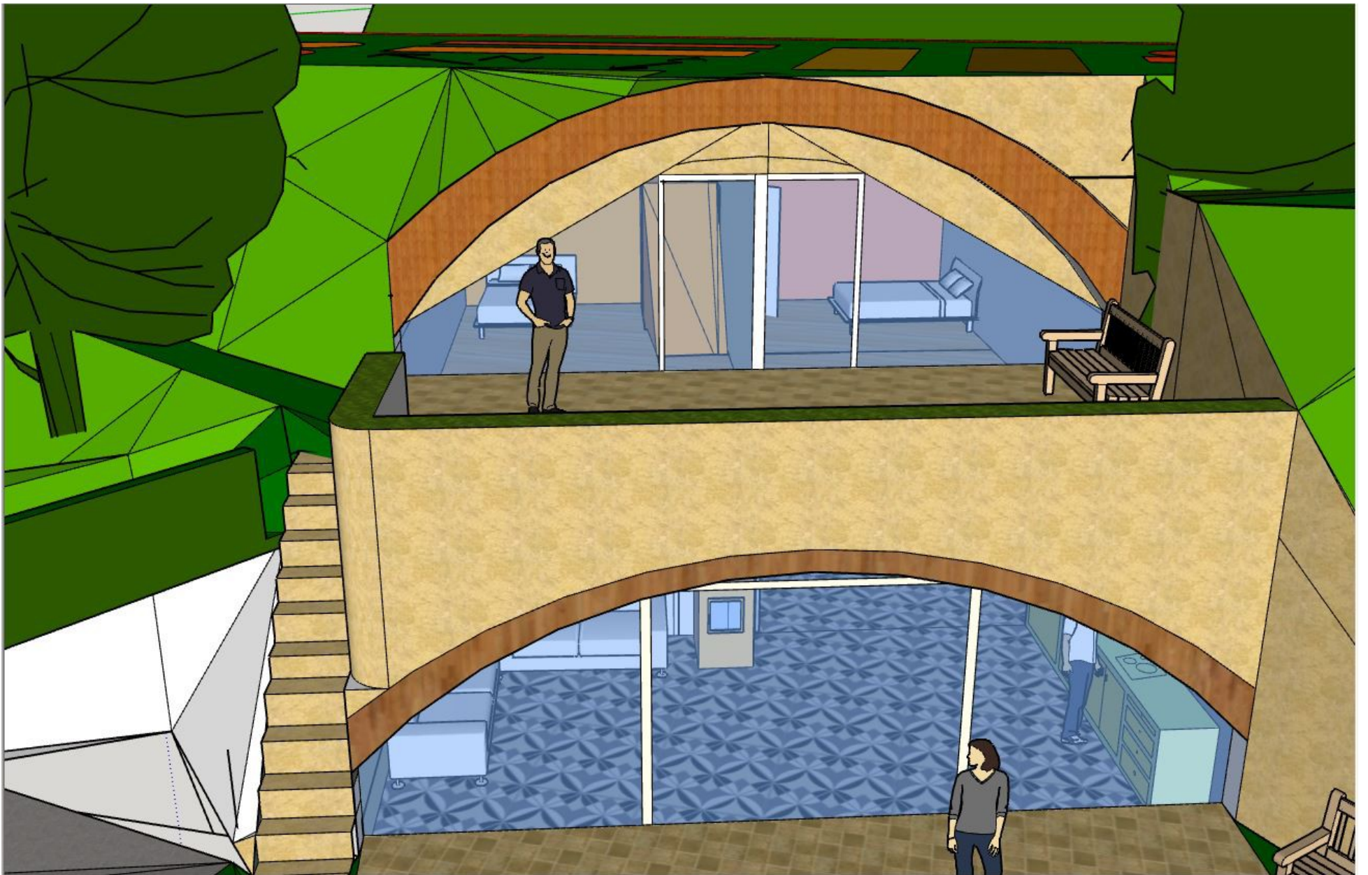
Schlafzimmer oben mit Terrasse Wohnzimmer+Küche